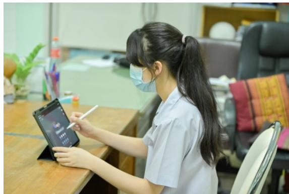
ตัวอย่าง มุมกล้องขณะทำการสอบออนไลน์

9. ให้นักเรียนลงทะเบียนโปรแกรม Zoom ผ่านลิงก์ที่กำหนดให้